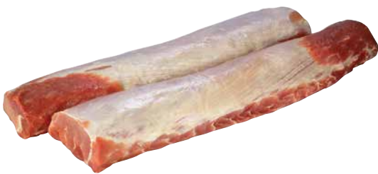
Schwein Karreerose tiefgekühlt im Karton 1 Krt. = 6 x ca. 3 kg, 37499