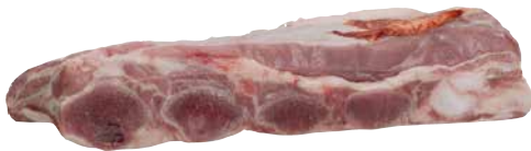
Kalb Short Ribs frisch aus Holland 1 Stk. = ca. 1,4 kg, 3175593