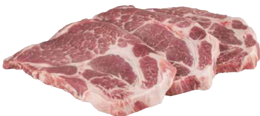
Schwein Schopfsteak 180 g ohne Knochen 1 Pkg. = 10 Stück, 9548