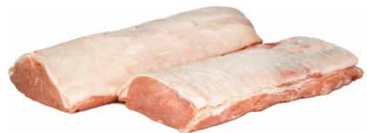
Kalb Karree ausgelöst, tiefgekühlt aus Holland 1 Stk. = ca. 5 kg, 3174448