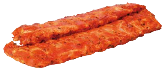
Schwein Spare Ribs mariniert 1 Pkg. = ca. 2 kg, 36475