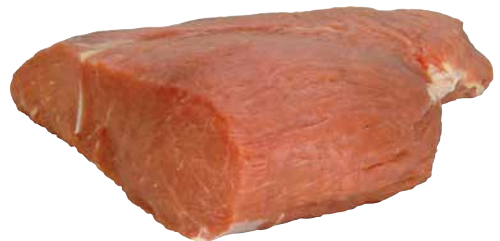
Kalb rosé Steakhüfte frisch aus Österreich 1 Stk. = ca. 1,4 kg, 3372588