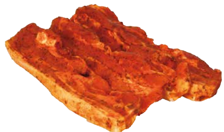
Schwein Bauchstreifen 10 x 180 g mariniert 1 Pkg., 1252584