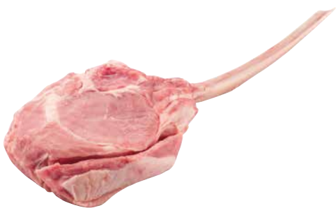
Kalb Tomahawk Steak frisch aus Holland 1 Stk. = ca. 450 g, 3137346