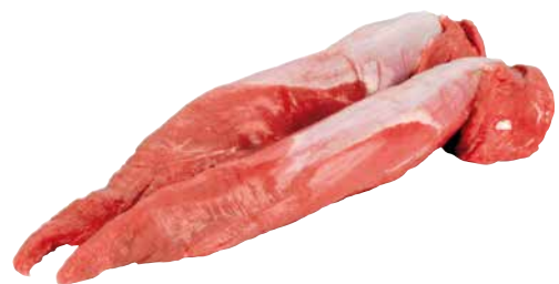
Kalbsfilet rosé, aus Österreich, 3653912 aus Holland, 3174471 tiefgekühlt 1 Stk. = ca. 1,2 kg