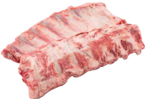
Kalb Spare Ribs frisch aus Holland 1 Stk. = ca. 1,8 kg, 3137353