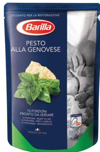
BARILLA PESTO alla Genovese 1 Krt. = 6 Stk., 500 g, 833681