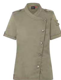
KARLOWSKY DAMEN KOCHJACKE ROCK CHEF vintage green versch. Größen 1 Stk., 1 Stk.