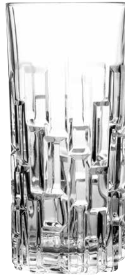
ILIOS TRINKGLAS GRAFFITY ROCK 360ML 1 Krt. = 6 Stk., 1 Stk., 3594504