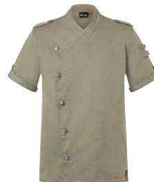
KARLOWSKY HERREN KOCHJACKE ROCK CHEF vintage green versch. Größen 1 Stk., 1 Stk.