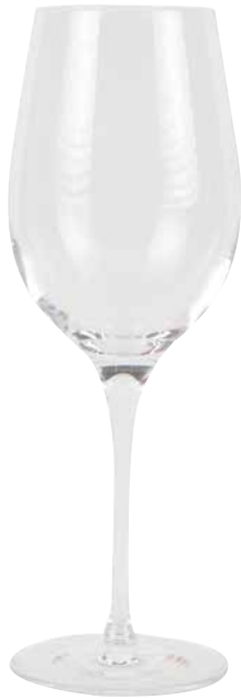
WEINGLAS ILIOS NR. 1 Inhalt = 385 ml, mit 1/8 l Füllmarke 1 Krt. = 6 Stk., 1231745