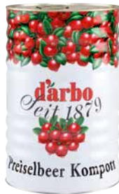
DARBO PREISELBEER KOMPOTT Fruchtanteil 62 % 1 Stk., 4,6 kg, 68890