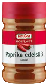
KOTÁNYI PAPRIKA EDELSÜSS 1 Stk., 1200 ccm, 193979