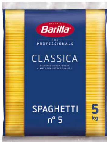
BARILLA TEIGWAREN versch. Sorten 1 Krt. = 3 Pkg., 5 kg