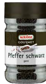
KOTÁNYI PFEFFER SCHWARZ GANZ 1 Stk., 1200 ccm, 194035