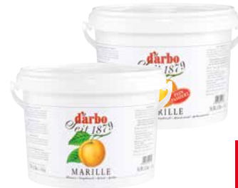
DARBO 45% Fruchtanteil Marille, 323105 Marille passiert, 29207 1 Stk., 5 kg