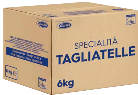
BARILLA TAGLIATELLE SEMOLA 1 Pkg., 6 kg, 919308